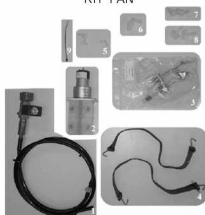
KIT 1 AN