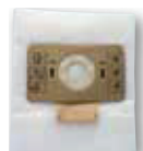
1 x sac microfibre