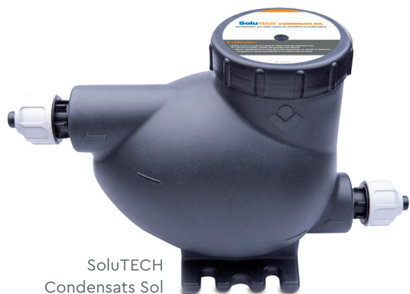
SoluTECH Condensats Sol

» 3 modèles selon puissance (< 35 kW - < 350 kW)