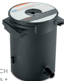
SoluTECH Condensats +