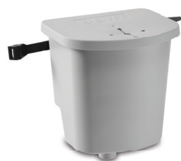
SoluTECH Condensats 0-35 kW