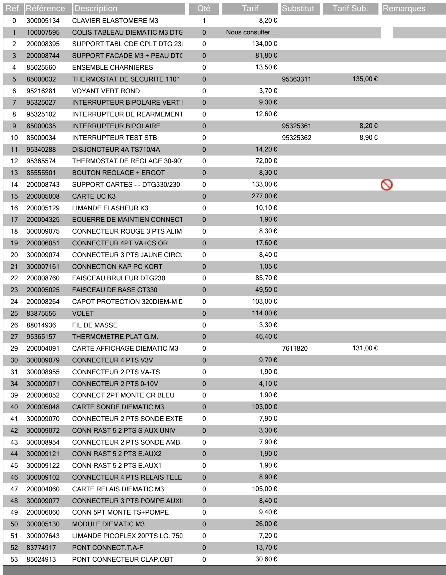
TABLEAU DTG 230/330 DIEMATIC M3